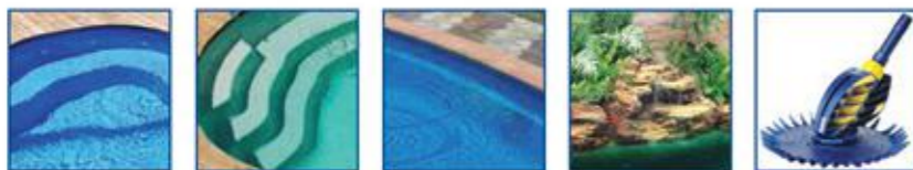
Banquettes extra larges Escalier intégré Marche périphérique Pré-équipement cascade Robot