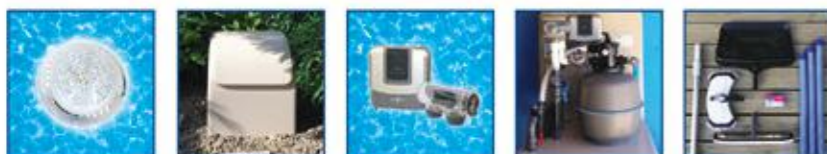
2 projecteurs à leds Local silencieux Système au sel régulateur de pH Filtration haut de gamme Kit d'entretien