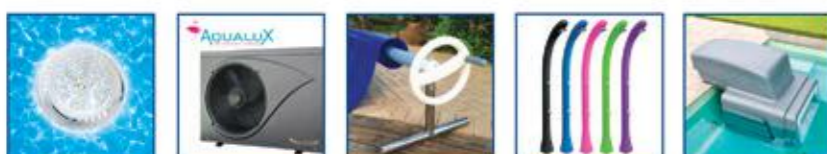
Projecteur(s) supplémentaire(s) 11 Pompe à chaleur Couverture solaire + Enrouleur Douche solaire ou Inox Nage à contre courant

Disponibles avant et après l'installation de votre piscine :