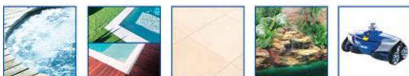
Système Balnéo à air pulsé 11 ou pack hydrojet Margelles en grès cérame (5 couleurs) Dallage en grès cérame Cascade rocher Robot Zodiac AX-20