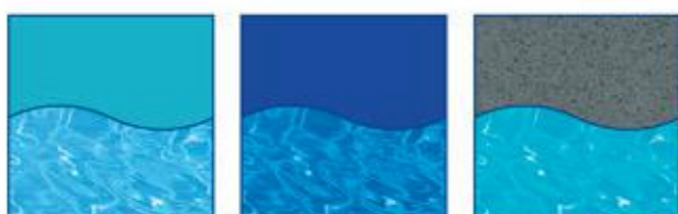
Bleu Corail 12 Bleu Bermuda 12 Gris Quartz 12

11) Option à prévoir avant l'installation